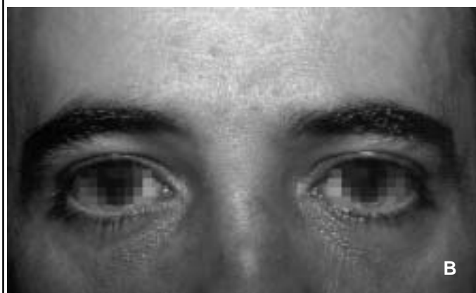
Figure 6 : Chirurgie de poches palpébrales inférieures isolées. A : avant l'intervention ; B : 3 mois après étalement de la graisse en avant du rebord oculaire.

fira pas de tirer sur la peau qui a perdu son élasticité car dans ce cas, quelques mois plus tard, le résultat de l'opération sera perdu.