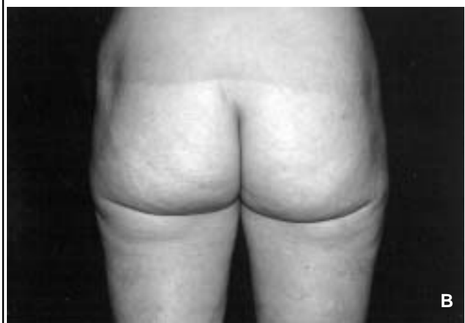
Figure 1 : Liposuction (retrait de 800 cc). A : avant liposuction ; B : résultat 6 mois après l'intervention.

La liposuction est cependant une intervention à haut degré de satisfaction pour les patientes et à condition d'être faite par des chirurgiens entraînés ; le risque de complications est très réduit.