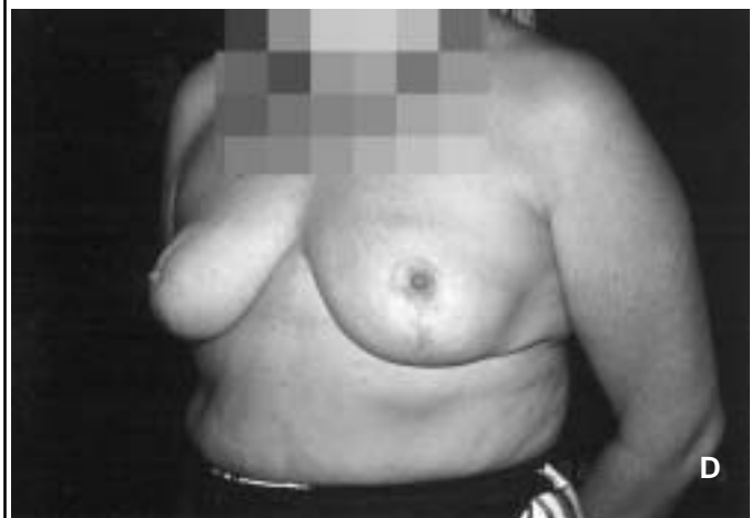
Figure 3 : Réduction mammaire (résection de 650 g à droite et 560 g à gauche). A, B : avant résection ; C, D : résultat 14 mois après l'intervention.