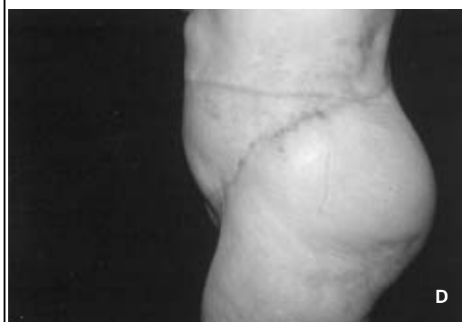
Figure 2 : Plastie abdominale (résection de 1,8 kg). A, B : avant résection du tablier abdominal ; C, D : résultat 1 an après l'intervention.