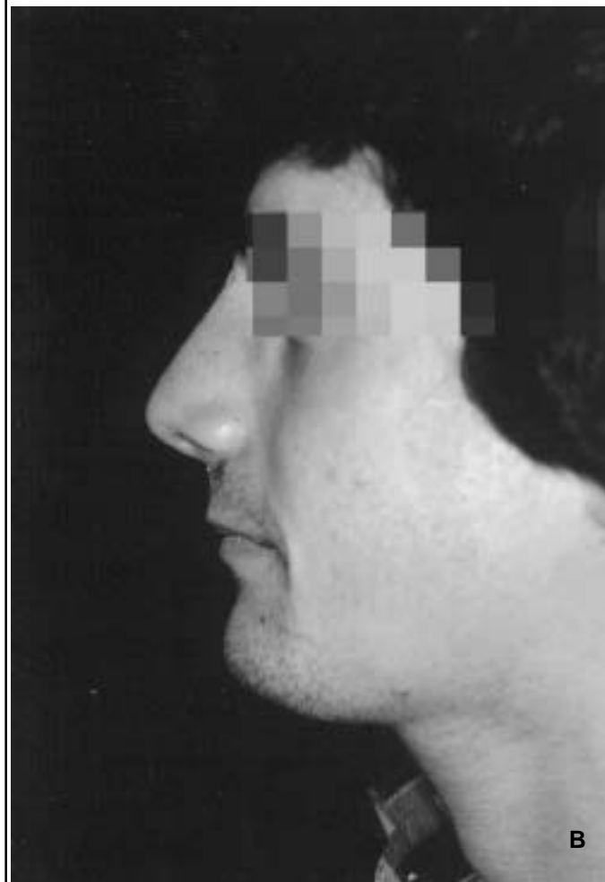
Figure 7 : Rhinoplastie. A : avant rhinoplastie ; B : 6 mois après correction nasale par ostéotomie et avancement du menton.