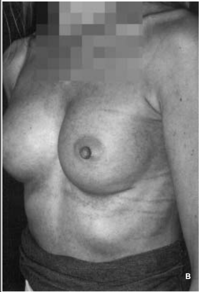
Figure 4 : Augmentation mammaire (mise en place de prothèses de 250 cc sous-pectorales). A : avant la mise en place des prothèses ; B : 1 an après l'intervention.

tes. Elle consiste en une réaction fibreuse périprothétique qui nécessiterait éventuellement un traitement de capsulotomie chirurgicale.