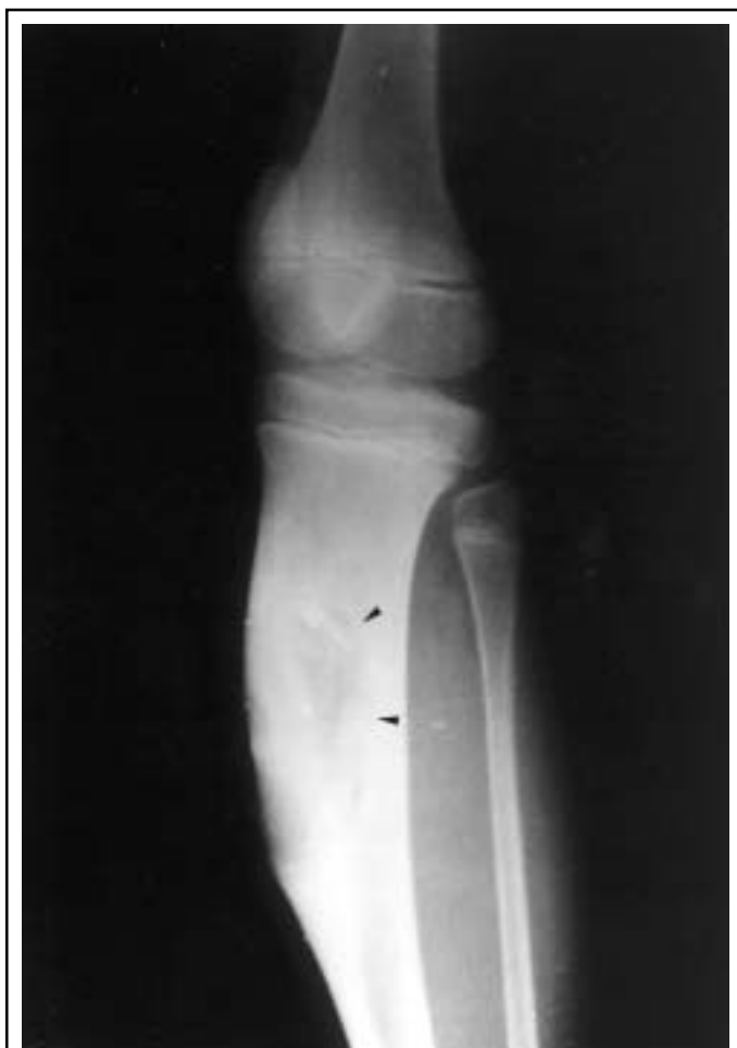
Figure 1 : Fibrome chondromyxoïde : image lacunaire diaphysaire de l'extrémité supérieure du tibia, excentrée, bien circonscrite, soufflant la corticale sans la rompre et bordée d'un fin liseré d'ostéosclérose en profondeur (▶).

du tiers supérieur de la jambe gauche. Elle est dure, douloureuse à la pression et fait corps avec l'os. L'imagerie met en évidence une lésion lytique diaphysaire latéralisée, bien limitée soufflant la corticale et bordée par un fin liseré d'ostéocondensation en profondeur (Figure 1). Un curetage de la tumeur est réalisé et de nombreux fragments d'aspect cartilagineux (une quarantaine) sont adressés au service d'anatomie pathologique. Ils pèsent au total 30 g et sont inclus en totalité. En microscopie optique, la grande majorité de ces fragments est constituée d'un tissu chondromyxoïde richement cellulaire montrant quelques cellules atypiques mais sans activité mitotique. Il existe par ailleurs un contingent fibreux lâche fait de cellules fusiformes ou stellaires ne montrant ni atypie cytonucléaire, ni mitose. Compte tenu de l'aspect radiologique, cet aspect morphologique était en faveur d'un fibrome chondromyxoïde. Six mois après, il y a eu une récurrence tumorale avec apparition d'une tuméfaction en regard de l'ancienne incision chirurgicale. On a réalisé alors une résection de la saillie antéro-interne du tibia gauche emportant la totalité de la tumeur. Le recul actuel est de 12 mois sans récurrence tumorale.