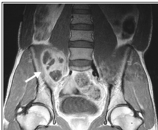
Figure 2 : IRM abdominale inférieure en coupe frontale avec séquence spin echo T1 après injection de Gadolinium : abcès multi-localaire (7 x 5 x 3 cm) en avant et au-dessus de l'articulation sacro-iliaque droite (→). Les coupes plus postérieures, non montrées ici, révèlent un élargissement de l'interligne sacro-iliaque droit, une ostéolyse du versant sacré et des phénomènes inflammatoires intraspongieux au niveau des berges articulaires.

Enfin, une scintigraphie au technétium 99 révèle une hyperfixation sacro-iliaque droite.