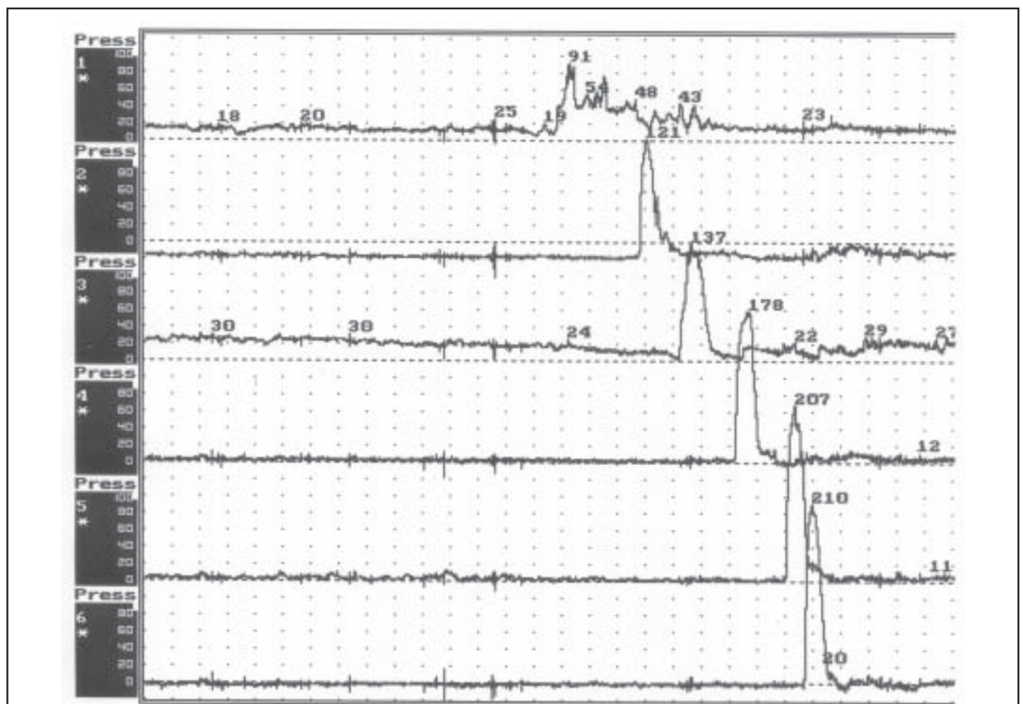
Figure 2 : Manométrie colique avec une sonde perfusée à 6 canaux espacés de 10 cm. Amplitude en mmHg. Durée entre deux marques = 18 sec. Press 1 : au niveau de caecum et Press 6 : au niveau de l'angle sigmoïdo-colique. Propagation, de Press 2 à 6, d'ondes de grande amplitude après stimulation par bisacodyl : 0.2 mg/kg instillés dans le caecum.

Le reflux gastro-oesophagien (RGO) , si souvent diagnostiqué en pédiatrie, est considéré comme une insuffisance transitoire du fonctionnement du sphincter oesophagien inférieur (SOI). Le plus souvent c'est le fonctionnement de la jonction