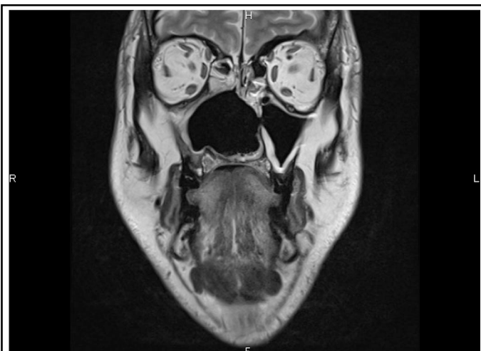
Figure 1 : IRM pondérée T2 dans le plan frontal démontrant la destruction complète du septum nasal et des cornets.