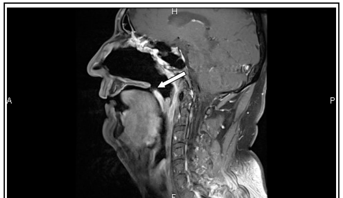
Figure 3 : IRM pondérée T1, après injection de gadolinium et suppression du signal de la graisse, dans le plan sagittal. La flèche démontre le défaut à la limite du palais osseux et du voile du palais.