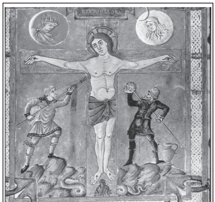
Figure 1 : La crucifixion de Jésus.

Il est fort possible voire probable que c'est ce type d'éponge qui fut présentée à Jésus (figure 1) lorsque, après avoir crié " Elohim pourquoi m'as-tu abandonné ", il dit " j'ai soif " et quelqu'un lui présenta