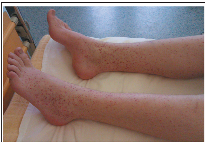
Figure 1 : Pétéchies en majoration.